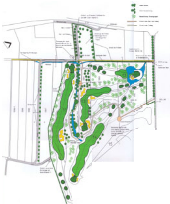
Übersicht über die geplante Platzerweiterung

Die Erweiterung soll bei idealem Verlauf von Planung, Genehmigung und Finanzierung in den Jahren 2006 und 2007 erfolgen.