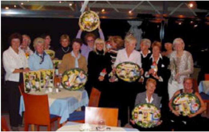
Strahlende Gesichter im Kreise der Siegerinnen

In diesem Jahr waren unsere Damen-nachmittage anders als im Vorjahr gestaltet. Die Fligeteinteilung erfolgte über das Ziehen von Karten, so daß sich immer wieder neue Zusammenstellungen ergaben. Wir hatten einige Neuzugänge, die sich durch dieses Konzept problemlos in unsere Gruppe eingegliedert haben und so schnell neue Kontakte fanden. Alles in allem haben wir 8 Turniere gespielt, davon ein auswärtiges Freundschaftsturnier in Pfaffing. 4 Turniere waren vorgabewirksam und es gab 19 Handicap-Verbesserungen. Insgesamt haben bei den Turnieren 249 Damen (Hcp 14 - 54) mitgespielt, davon 24 Gäste. Die Preise wurden teilweise aus der Damenkasse und den eigenen Reihen gesponsert. Weiterhin haben uns FPV Feinkost Präsente, Schönweitz Optic und Samen-Schmitz sehr großzügig mit Preisen bedacht.