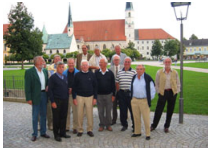
Unsere Senioren auf ihrer „Tour“ durch die andere Seite von Oberbayern

Bei einem zünftigen Abendessen und einem kühlen Bier im Andechser Gasthof in Altötting klang der erste Tag froh und munter aus. Am zweiten Tag ging es zum Golfclub Altötting-Burghausen, Schloss Piesing. Dieser Golfplatz besitzt eine ansprechende Waldkulisse mit sanften Geländeformen, der für jede golferische Spielstärke eine faire Herausforderung war.