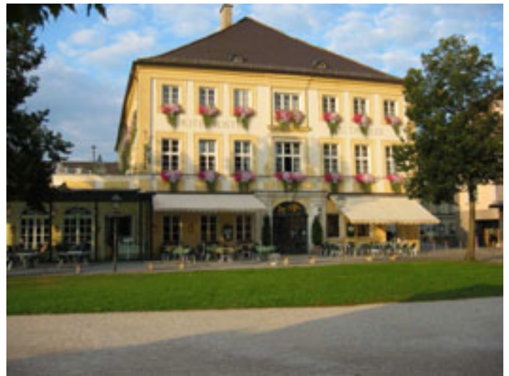
Hotel zur Post in Altötting

bezogen wir Quartier im Hotel zur Post in Altötting.