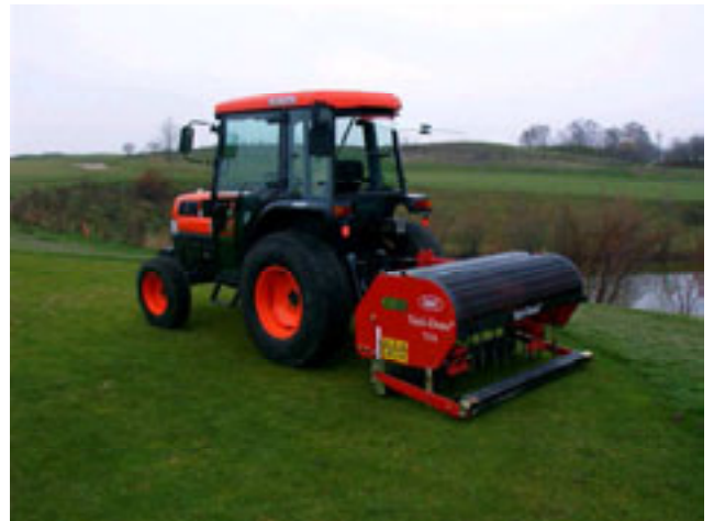
Aerifizierer mit vorgespannter Zugmaschine

verringern sich Wasser- und Luftdurchlässigkeit, die Wasserspeicherung hingegen nimmt zu. Die Gräser ersticken in ihrem eigenen „Abgas.“ Um dies zu verhindern, muß das durch die Atmung von Pflanzenwurzeln und Mikroorganismen erzeugte Kohlendioxid (CO 2 ) abgeführt und frischer Sauerstoff zugeführt werden. Dies wird durch das mechanische Belüften (=Aerifizieren) des Bodens erreicht. Das Aerifizieren zählt somit zu den wichtigsten Pflegearbeiten auf einem Golfplatz.