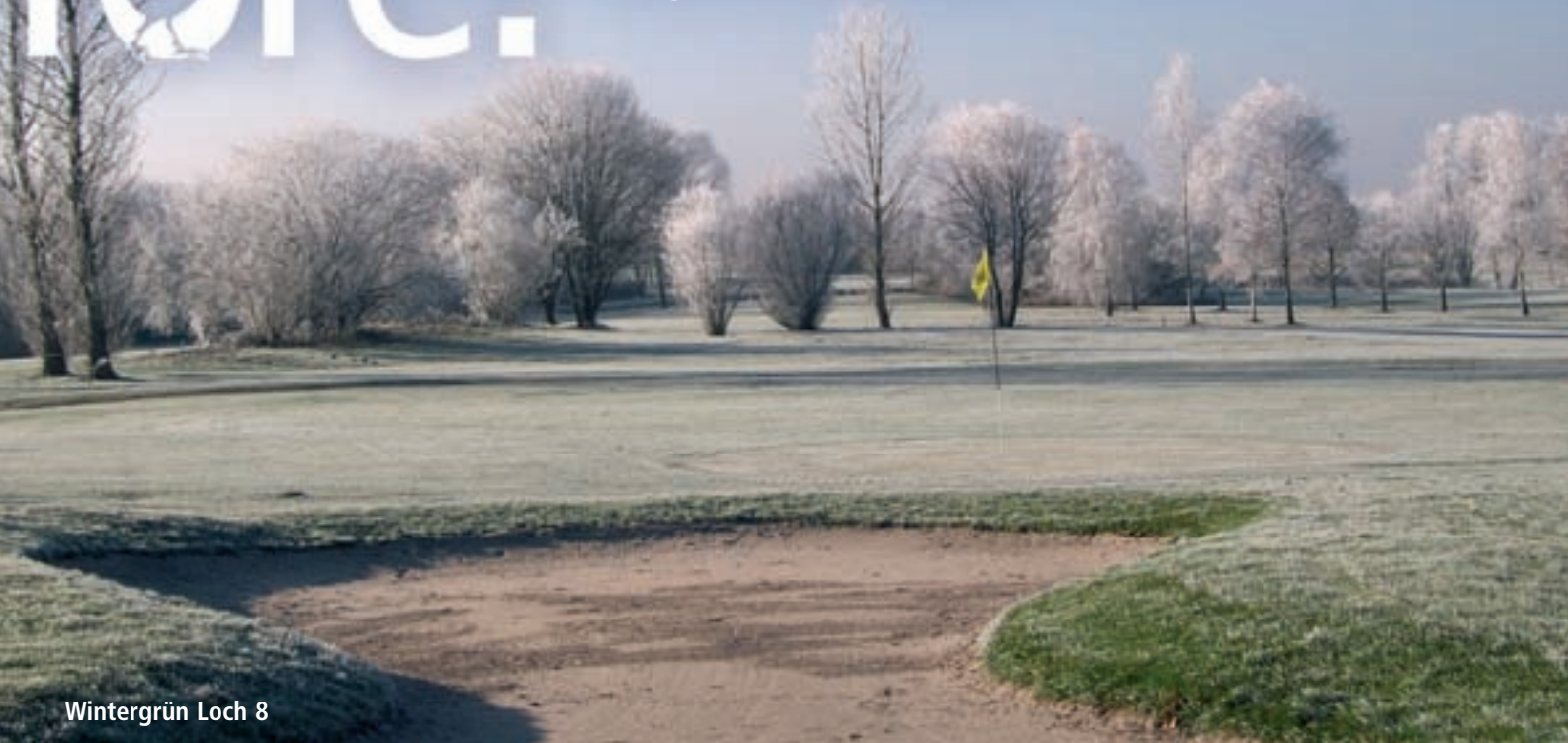
Wintergrün Loch 8