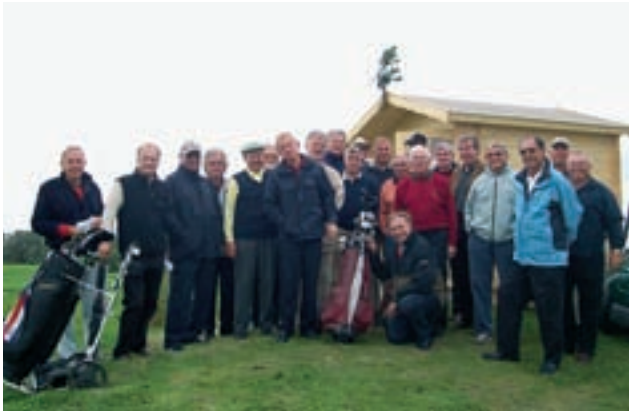
Die Aschheimer Senioren bei der Einweihung der neuen Schutzhütte

Fast alle haben sie sicher schon gesehen. Sie thront über Bahn 15 und ist auch von den Bahnen 11, 12 und 14 schnell zu erreichen. Die Rede ist von der neuen Schutzhütte. Die Senioren des Golfparks München Aschheim förderten die Anschaffung dieser seit langem notwendigen Schutzhütte und beteiligten sich zu 50% an den Kosten. Natürlich wurde die Hütte Ende September auch stiecht mit einem Fest mit Bratwürsten und Freibier eingeweiht.