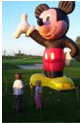
Die übergroße Mickey Mouse begeisterte die Kleinsten

abteilung (Bogey-Golfer) statt. Bereits am Nachmittag spielten 45 Kinder und Jugendliche um den begehrten Mickey Mouse Cup, für den Disney tolle Preise zur Verfügung stellte.