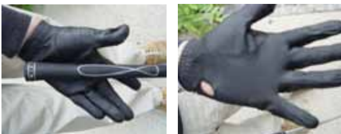
Falscher Griff mit dem Handballen(links)und das Ergebnis (rechts)

Viele Golfspieler kommen zu uns, und des öfteren sehen wir dann Handschuhe mit Löchern in der Handballengegend. Das liegt meistens an einem falschen Griff, strapaziert das Material unnötig und führt auch zu Fehlern im Schwung.