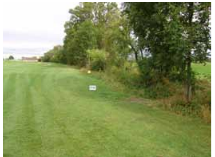
Durchgang zwischen Bahn 12 und 13

Bitte beachten Sie, dass das Biotop zwischen den Spielbahnen 12 und 13 ca. 80 m vom Damenabschlag entfernt überquert werden darf (Hinweisschild beachten). Damit können auf Bahn 13 gelandete Bälle ohne nennenswerte Umwege und ohne Spielverzögerung weitergespielt werden.