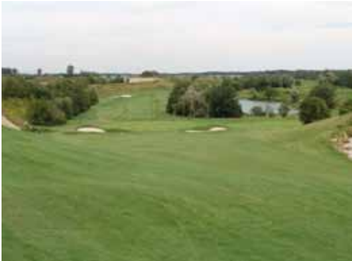
Die neue verbreiterte Bahn 5

Die Arbeiten zur Erweiterung der Landezone an Bahn 5 sind abgeschlossen. Sobald die Soden im Erweiterungsteil vollständig angewachsen sind und das Gras auf die übliche Fairwayhöhe heruntergemäht werden kann, wird das derzeitige Fairway „im Knie“ auf Semiroughhöhe gemäht. Die Spielbahn wird dadurch etwa 25 m länger. Die Fairwaybunker werden nach Abschluss der Saison umgebaut und an die neue Spielsituation angepasst.