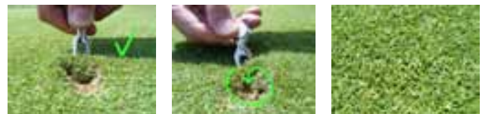
mit Pitchgabel und mehreren drehenden Bewegungen

Leider wird dabei jedoch mehr beschädigt, als dass der eigentliche Schaden beseitigt wird. Nachfolgend einige Fotos, die das korrekte Entfernen der Pitchmarken und das Resultat auf dem Grün zeigen.