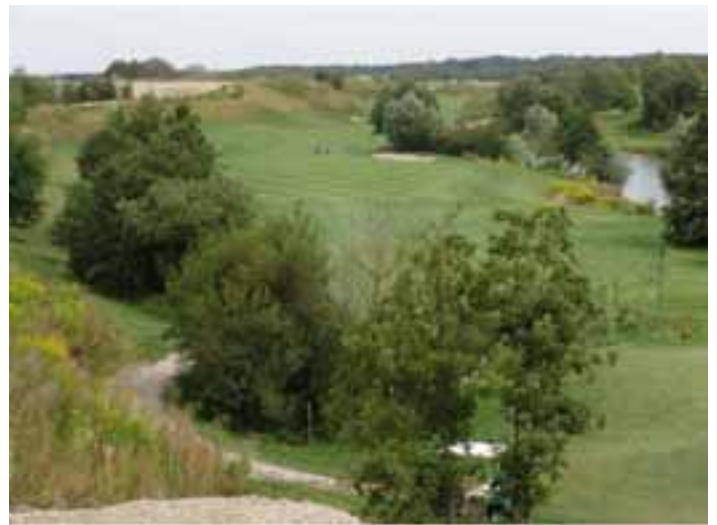
Der beeindruckende Blick vom zukünftigen Herrenabschlag auf Bahn 6

im Winter weitestgehend entfernt, so dass „freier Drive“ auf das Fairway möglich ist.