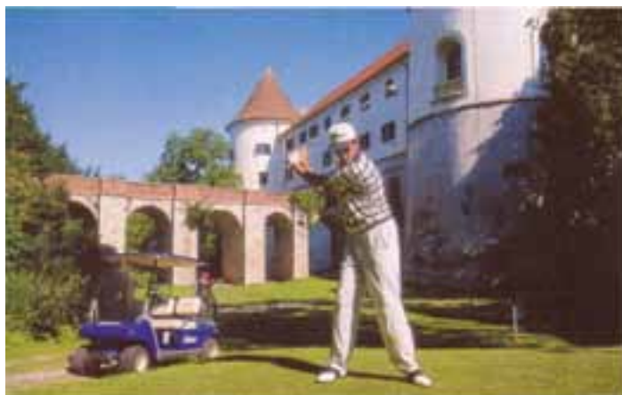
Idyllisch: Golf im Schlosspark Mokrice

In der hügeligen, grünen Umgebung des Schlosses befindet sich auch einer der schönsten Golfplätze in Slowenien. Hier ist dem international renommierten Golfplatzarchitekten Donald Harradine ein Meisterwerk gelungen. Die Golfbahnen führen durch den Schlosspark, vorbei an Obstplantagen und einem See. An manchen Löchern sind das coupierte Gelände und die natürlichen Hindernisse eine wahre Herausforderung für jeden Golfer. Einige Prospekte dieser schönen Golf-Destination liegen im Clubhaus aus.