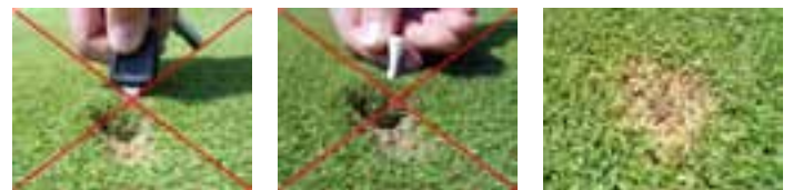
falsche Methoden und das "Ergebnis"

Leider wird dabei jedoch mehr beschädigt, als dass der eigentliche Schaden beseitigt wird. Nachfolgend einige Fotos, die das korrekte Entfernen der Pitchmarken und das Resultat auf dem Grün zeigen.