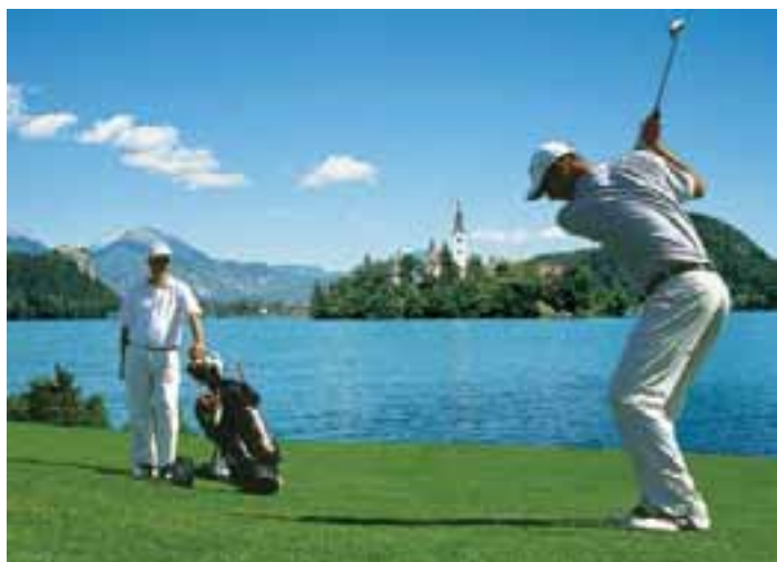
Golfen rund um Bled bietet alles was das Golferherz höher schlagen lässt

Immer noch ein Geheimtipp mit hervorragendem Preis-/Leistungsverhältnis für Golfer ist Slowenien, ein Land mit großem Reichtum an kulturellem und historischem Erbe. Der Golfplatz in Bled, nahe der Grenze zu Kärnten, ist dabei vielen Golfern schon lange ein Begriff, und die Golfparkanlage Aschheim hat dort auch seit längerem ein attraktives Greenfee-Abkommen mit 20 % Rabatt.